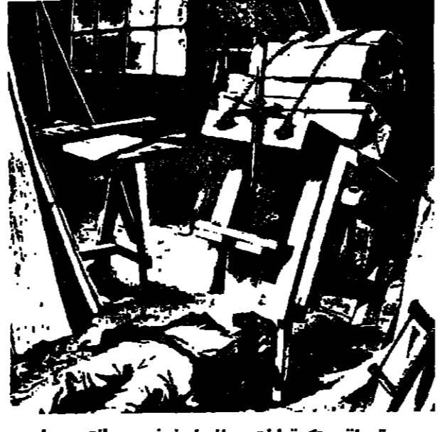
مقصلة مبتكرة اخترعها نجار فرنسي وانتصر بها

فإذا به صلوب على واجهة منزله ... ولكن الناس هرعوا اليه واقتوه ، وكان ذلك عام ١٨١٠ . مقصلة مبتكرة في العام ١٨٢٣ ، اخترع الكورسكي فيديريه بطريقه غير عادية ، وهو نسي الخامسة والاربعين من العمر ، ويقال انه ابن جلد مدينة باسبيا . وكثيرا ما كان يساعد اياه في قطع رؤوس الحكوميين بالادام ، فاقنني به الامر ان قطع